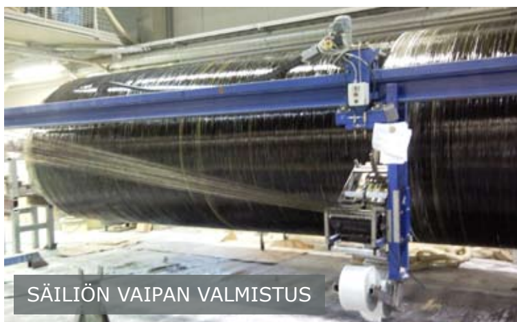
SÄILIÖN VAIPAN VALMISTUS